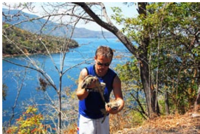
Na leguány narazíte v amazonských pralesích na každém kroku.