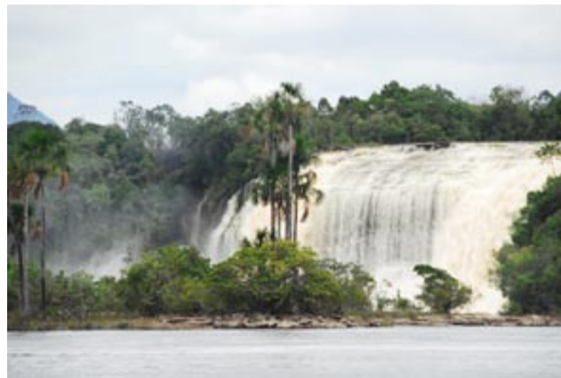
Úchvatné vodopády v Roraimě.

Na nejvyšším bodě (4 0005 metrů nad mořem) vysokohorské silnice ve venezuelských horách. Jiří Pergl (vpravo) říká, že na jiné automobily v těchto částech zeměkoule opravdu moc nedorazíte.