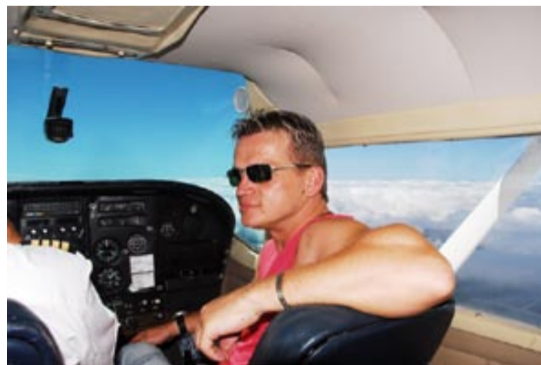
Let nad Stolovými horami a vodopádem Salto Angel byl zážitkem.